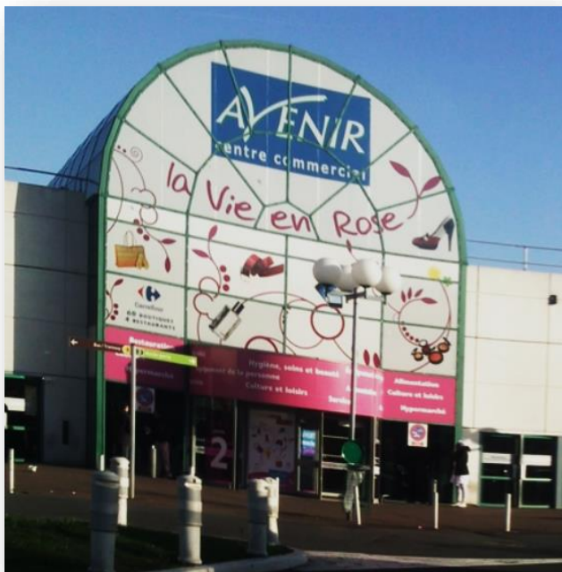
Centre commercial Avenir à Drancy (Seine Saint-Denis)

sont destinés à satisfaire tous les besoins des fanatiques de la carte de