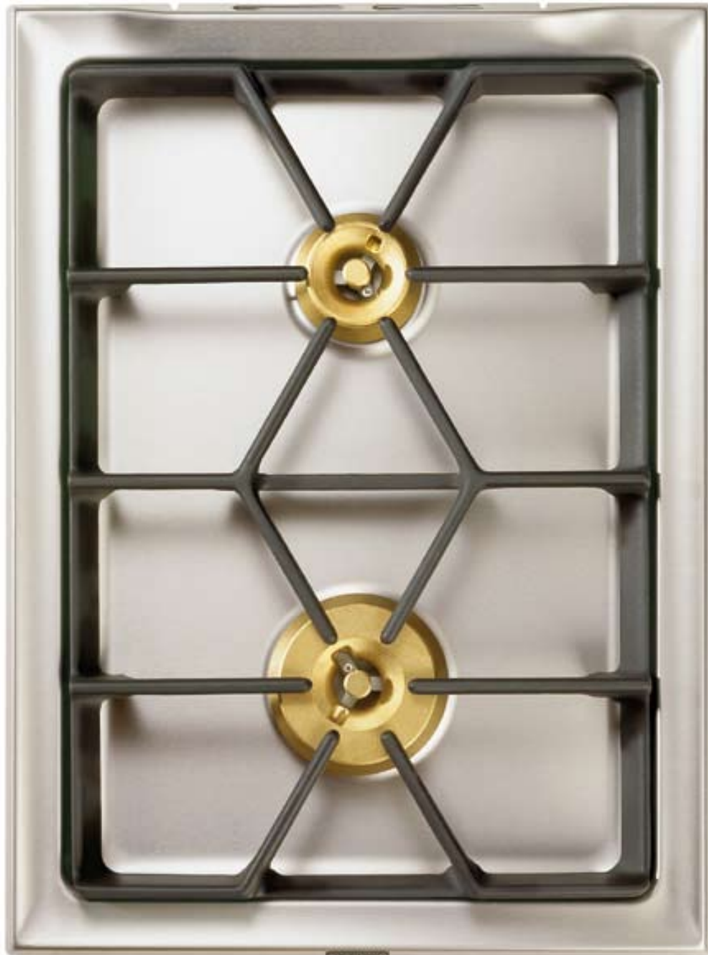
Varios gaz électronique de Gaggenau VG 442