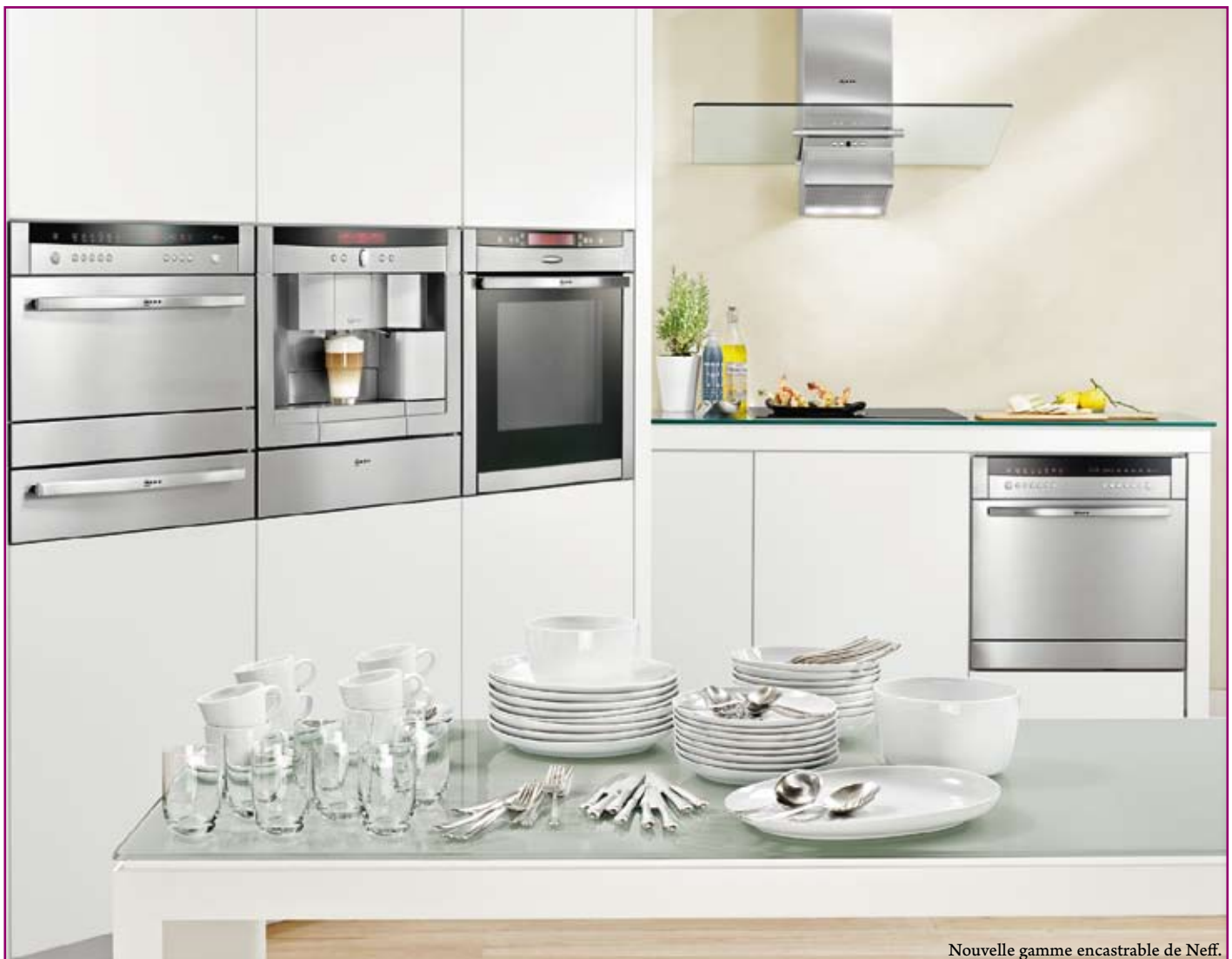
Nouvelle gamme encastrable de Neff.