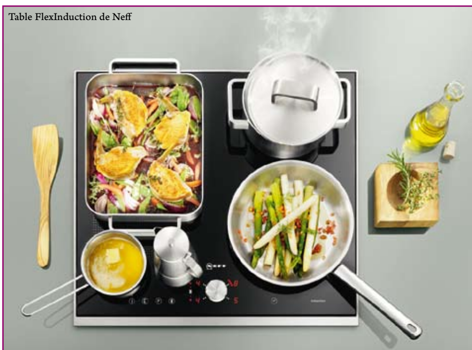
Table FlexInduction de Neff