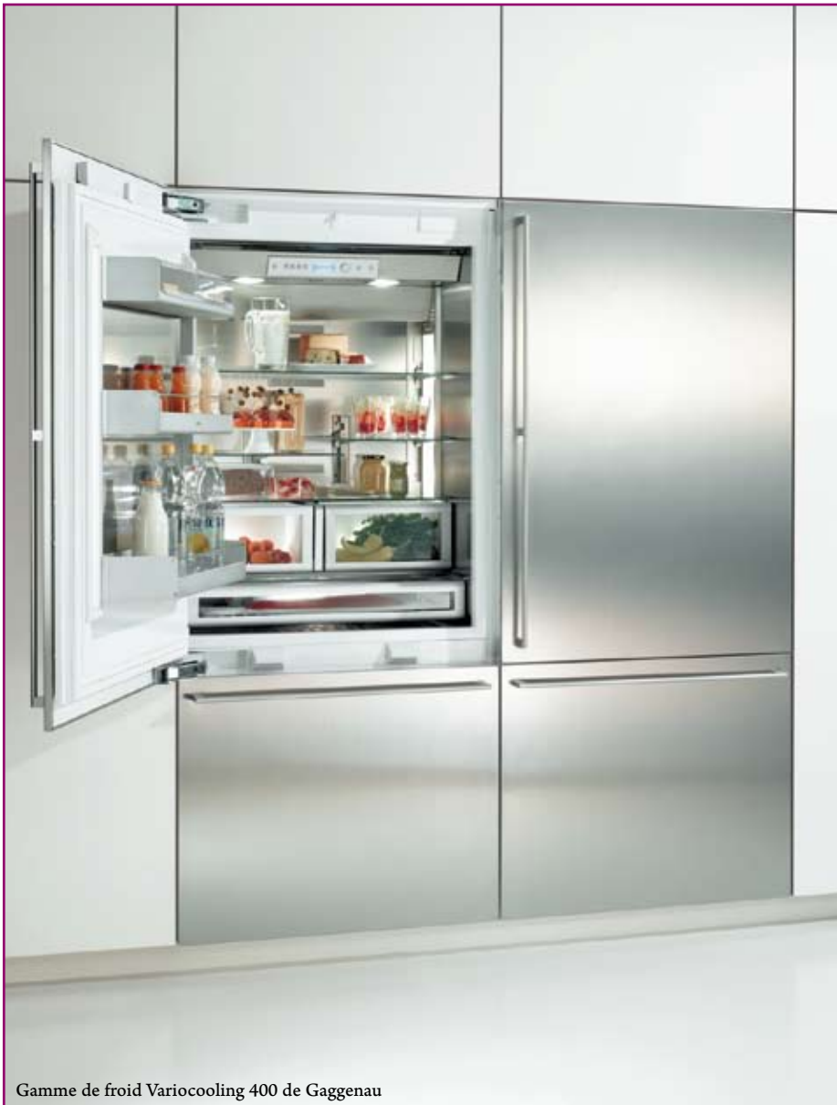
Gamme de froid Variocooling 400 de Gaggenau

re plus gênante, eu des effets pervers en termes de perception consumériste précédant les achats d'appareils ménagers.